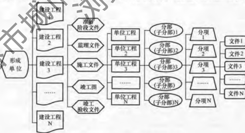
图 2 工程电子文件分类方案层级结构

2 对工程电子文件，可运用参建单位、文件类别、分部分项、专业等特征，采用图 2 所示的层级结构，按建设工程—文件