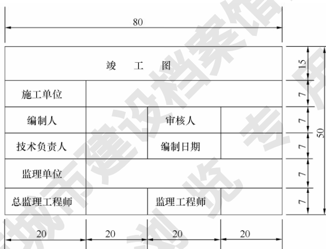
图 4.2.8 竣工图章示例

1 竣工图章的基本内容应包括：“竣工图”字样、施工单位、编制人、审核人、技术负责人、编制日期、监理单位、现场监理、总监。