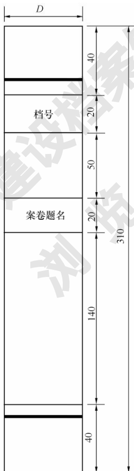
图 F 案卷脊背式样